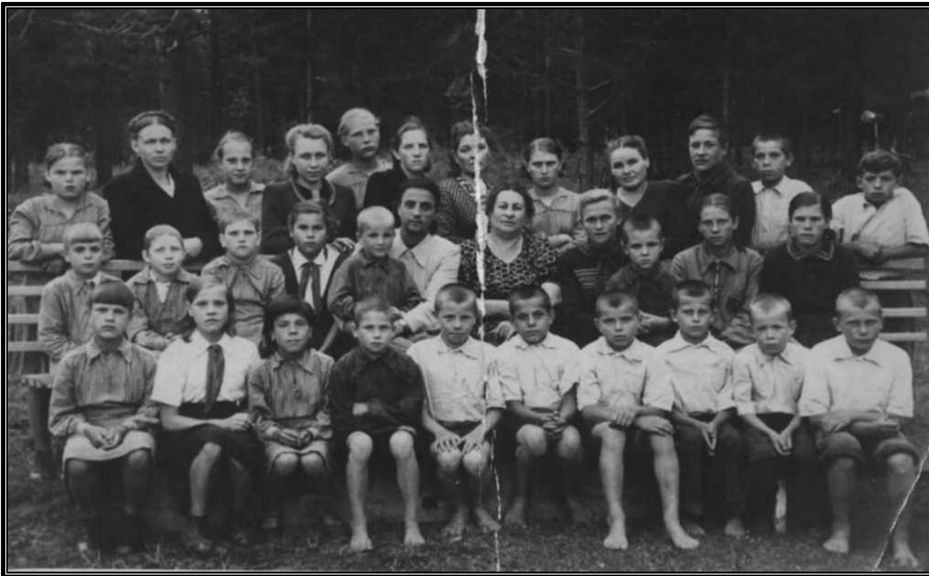
Детский дом. Воспитанники детского дома