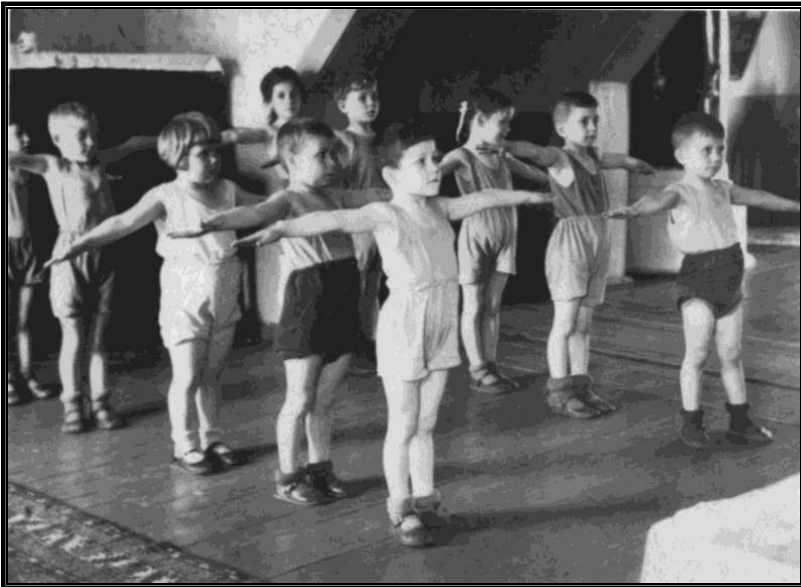
Музыкально-спортивный зал 1953 год