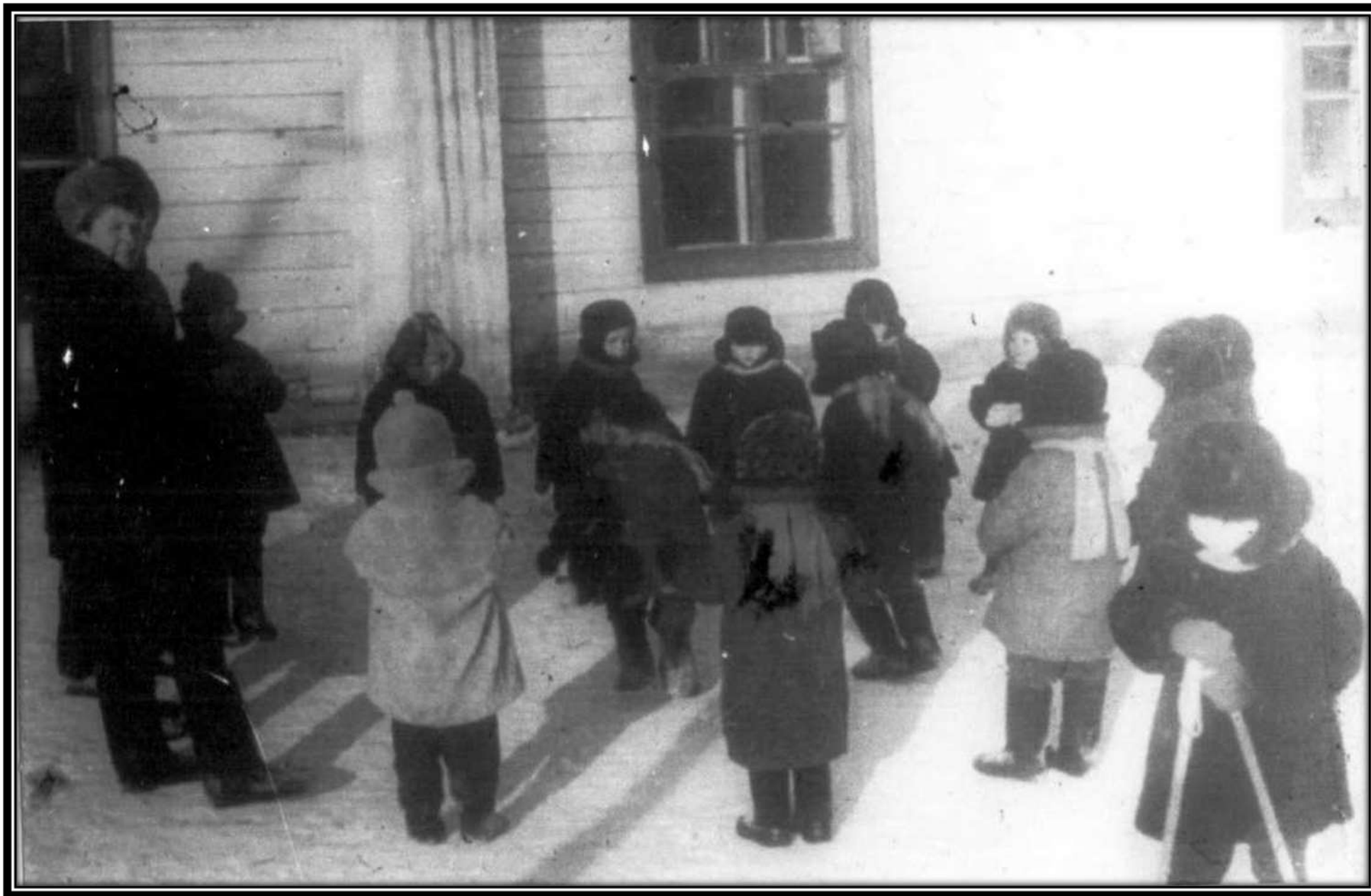
Детский сад № 38 на улице Белогорской