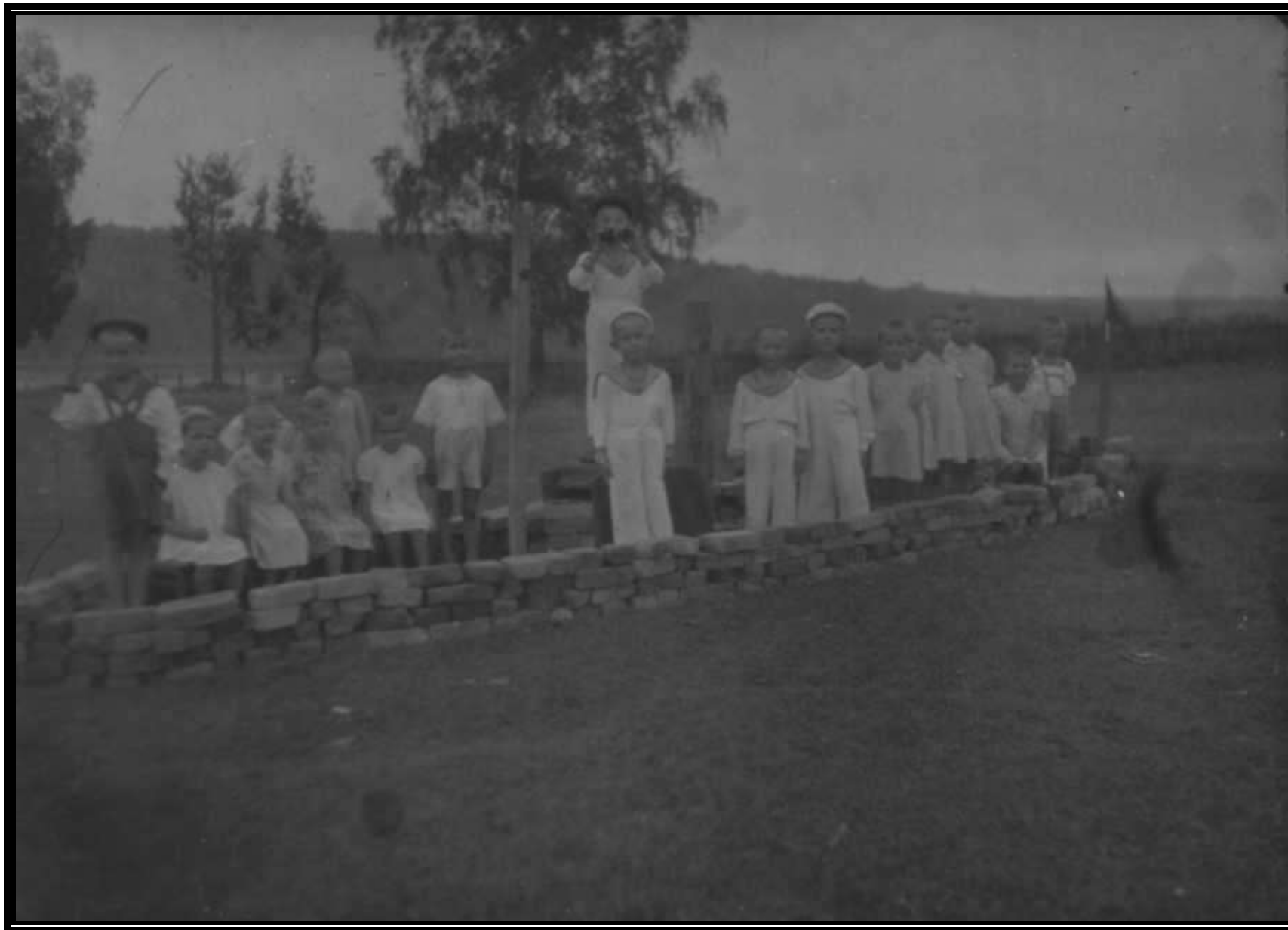
Игра в моряков