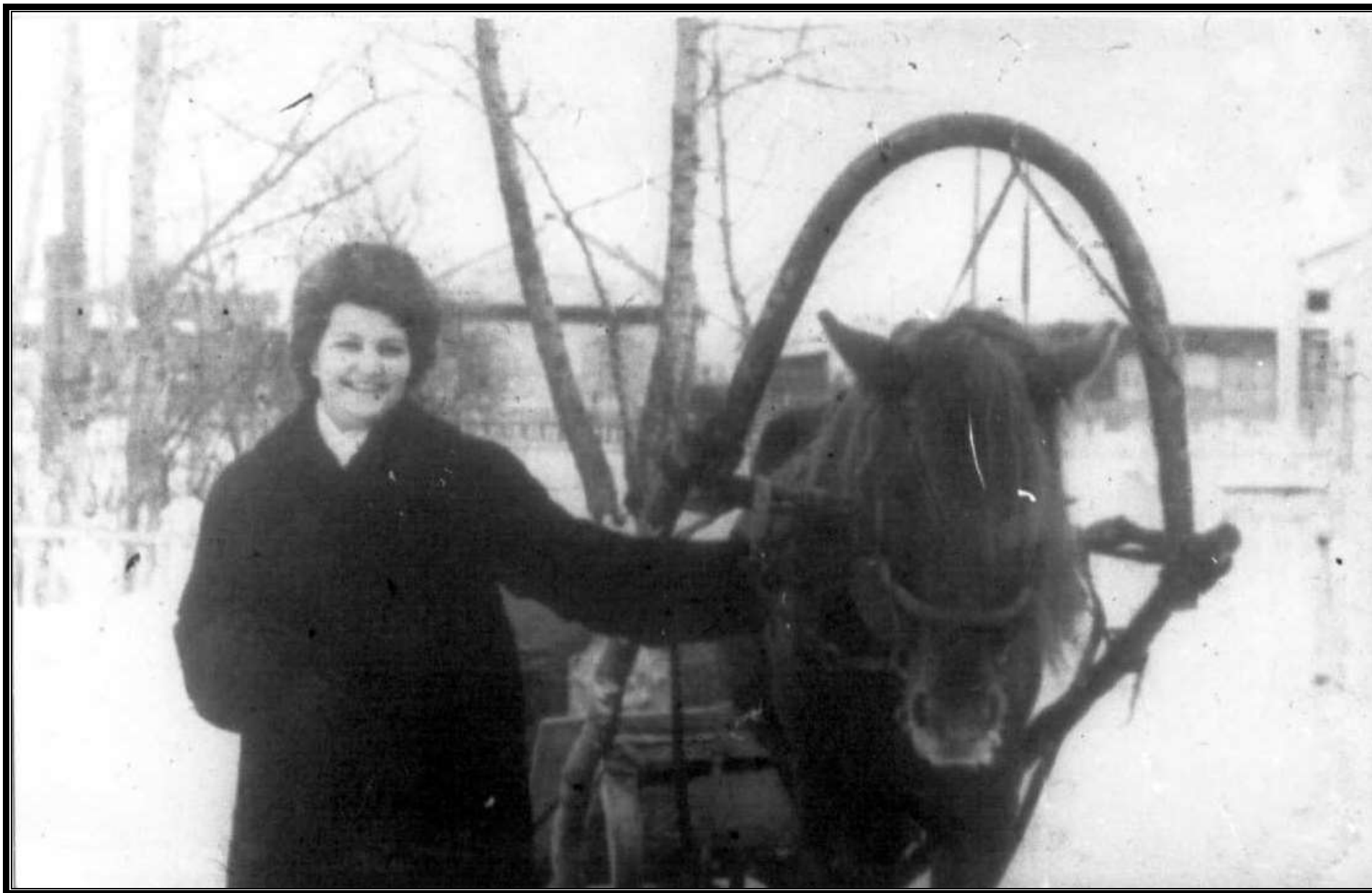
Завоз продуктов в детский сад