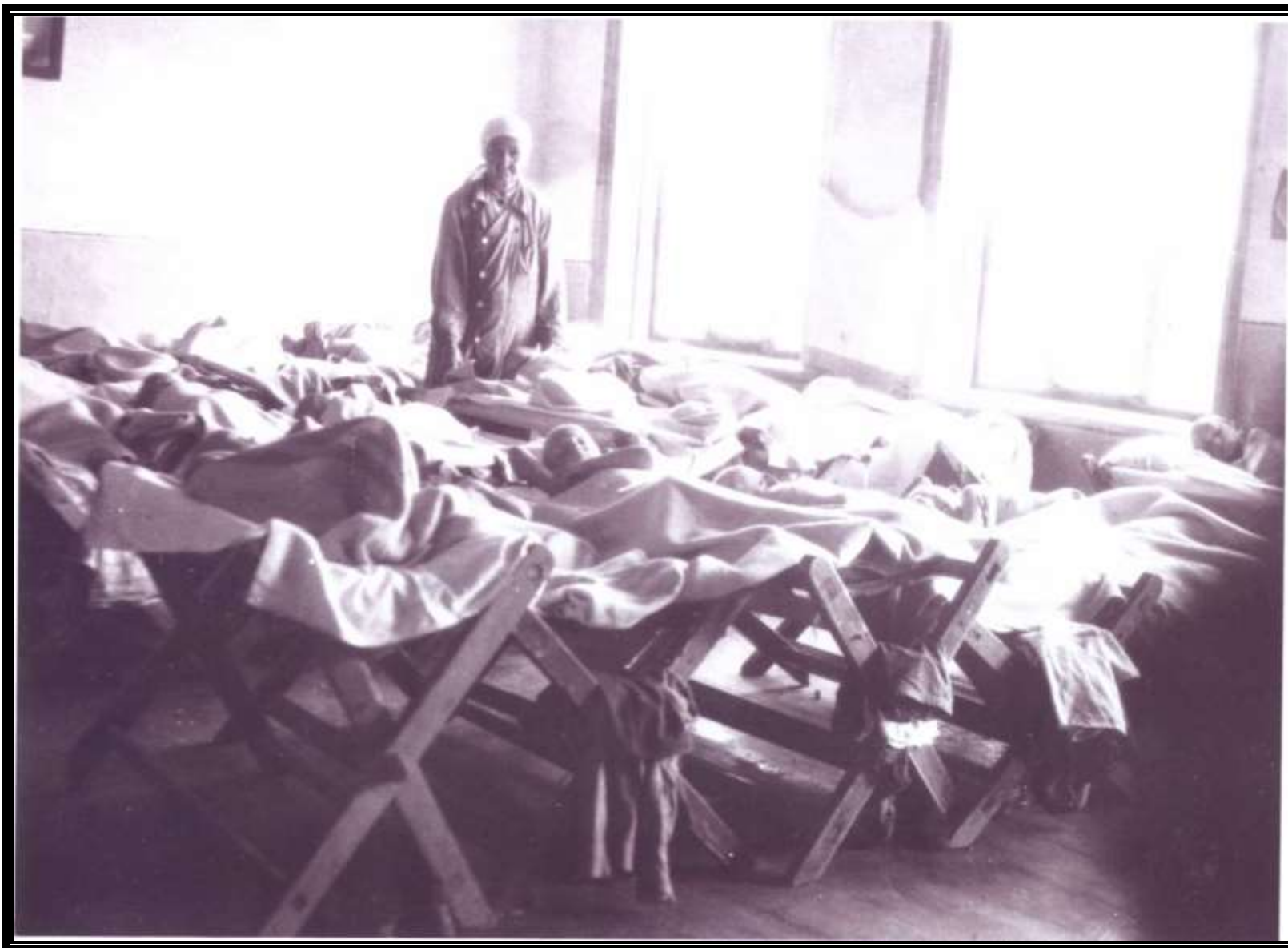
Спальня на раскладушках 1952 год