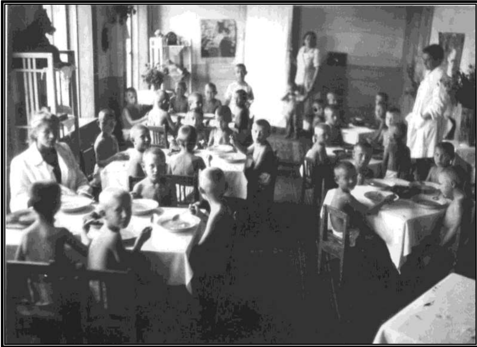
Первая дача в деревне Маручак. Столовая 1950-1952гг.