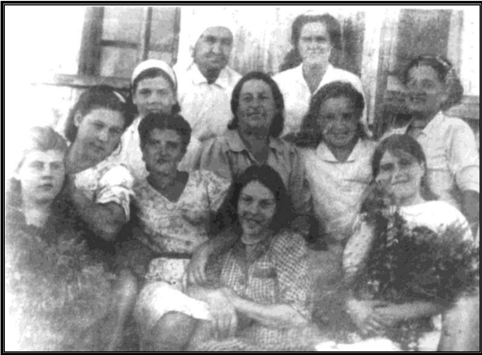
Коллектив детского сада №38 в 1944 году