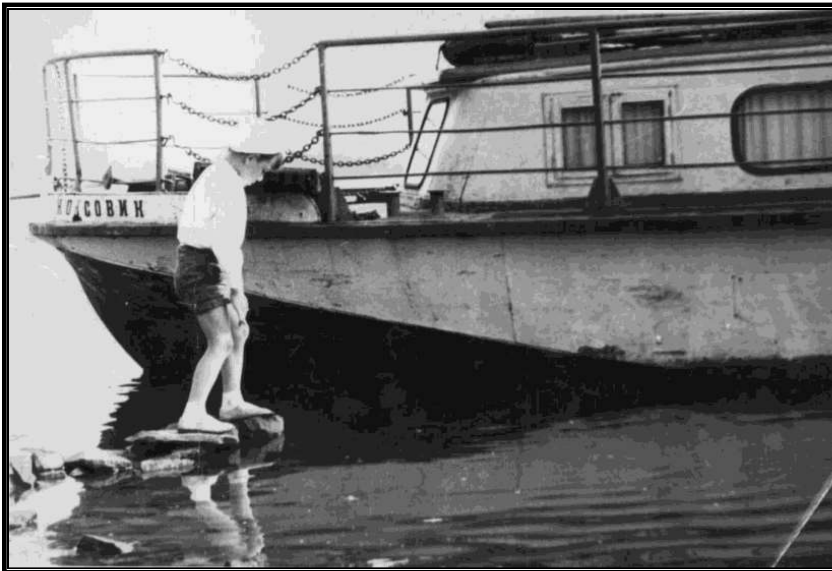
Катер "Коксовик", перевозил ребят на дачу в Елыкаево