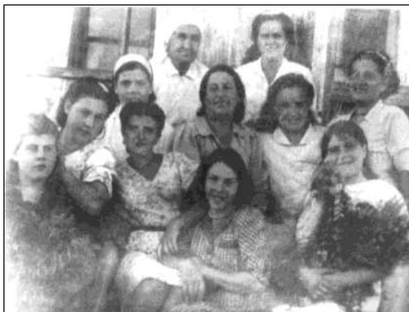
Коллектив д/сада №38 в 1944 году

Война не обошла горем никого. Но, вопреки всем трудностям и лишениям работники детского сада - скромные труженицы не теряли жизнелюбия и активности, все силы отдавали детям, воспитывали новое поколение маленьких кемеровчан.